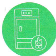
KOTEL NA BIOMASU